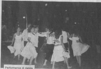
Performance di danza