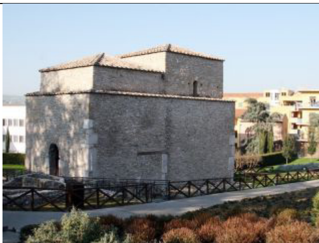
Il complesso monumentale di S. Ilario

Sono undici, con un ex-aequo, le poesie selezionate per la finale della 3 a Edizione del Premio di Poesia "Gerardino Romano". Una commissione tecnica ha valutato i 131 componimenti arrivati alla Fondazione "Gerardino Romano" di Telese Terme da diverse regioni d'Italia. "Paesaggi" è il tema sul quale si sono espressi i partecipanti.